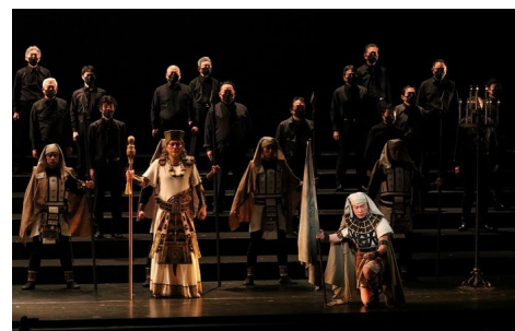
第 36 回伊丹市民オペラ定期公演『アイーダ』より