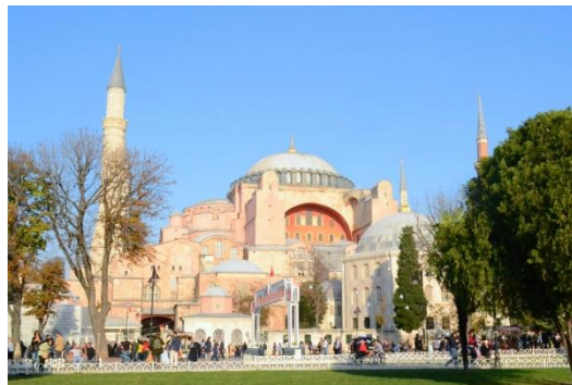
イスタンブールのアヤソフィア大聖堂（ハギア=ソフィア大聖堂）

関西学院大学・文学研究科博士課程後期課程単位取得退学。西洋史、とりわけイギリスやニュージーランドの現代史、軍事史などを研究している。大阪学院大学・国際学部講師、助教授、流通科学部准教授として教鞭を執り、現在同大学商学部教授。